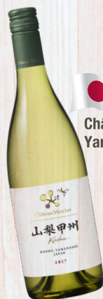
Chateau Mercian Yamanashi Koshu