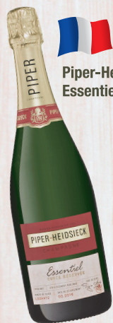
Piper-Heidsieck Essentiel Extra Brut