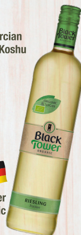
Black Tower Riesling Organic