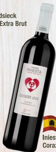
Iniesta Corazon Loco Tinto